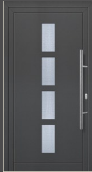
Modell Malena Aluminium-Füllung Anthrazit CH 703 mit Isolier-Glas: außen Float klar innen Mastercarré Edelstahlgriff 214