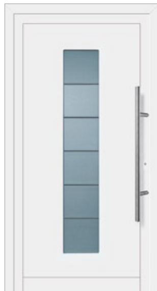
Modell Finnja Aluminium-Füllung Weiß RAL 9016 mit Isolier-Glas: außen Float klar innen Parsol grau sandgestrahlt mit klaren Streifen Edelstahlgriff 214

Der gute Griff, serienmäßig bei allen Modellen.