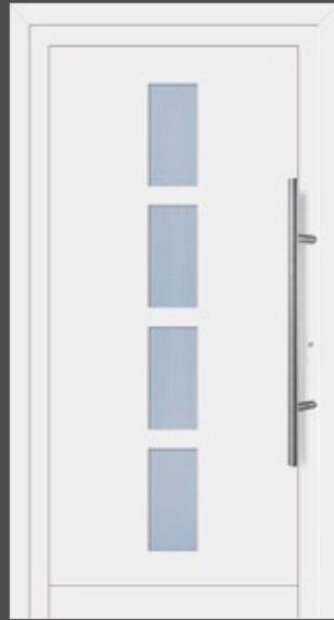
Modell Malena Aluminium-Füllung Weiß RAL 9016 mit Isolier-Glas: außen Float klar innen Mastercarré Edelstahlgriff 214

2-Scheiben-Isolier-Glas, 26 mm Einbaustärke, U-Wert ca. 1,1 W/m 2 K