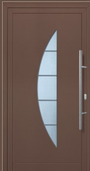
Modell Tiara Aluminium-Füllung Marone CH 607 mit Isolier-Glas: außen Float klar innen Float sandgestrahlt mit klaren Streifen Edelstahlgriff 214