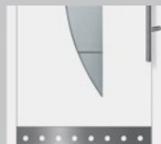
Sockelblech aus Edelstahl für Tür/Seitenteil