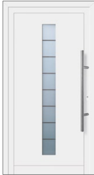
Modell Julissa Aluminium-Füllung Weiß RAL 9016 mit Isolier-Glas: außen Float klar innen Float sandgestrahlt mit klaren Streifen Edelstahlgriff 214

Fordern Sie unsere weiteren Fachprospekte über Aluminium-Haustüren und Holz-Haustüren an. www.steinau.com