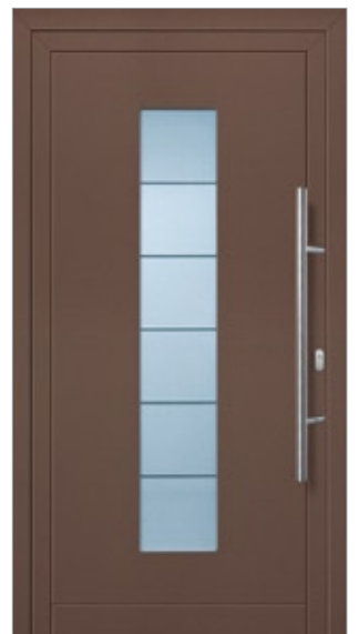
Modell Finnja Aluminium-Füllung Marone CH 607 mit Isolier-Glas: außen Float klar innen Float sandgestrahlt mit klaren Streifen Edelstahlgriff 214