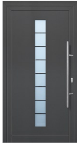
Modell Julissa Aluminium-Füllung Anthrazit CH 703 mit Isolier-Glas: außen Float klar innen Float sandgestrahlt mit klaren Streifen Edelstahlgriff 214