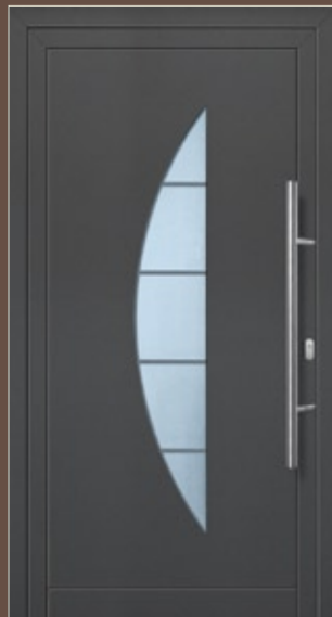
Modell Tiara Aluminium-Füllung Anthrazit CH 703 mit Isolier-Glas: außen Float klar innen Float sandgestrahlt mit klaren Streifen Edelstahlgriff 214