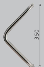
Edelstahlgriff 215 gebürstet