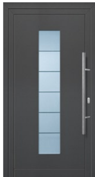
Modell Finnja Aluminium-Füllung Anthrazit CH 703 mit Isolier-Glas: außen Float klar innen Float sandgestrahlt mit klaren Streifen Edelstahlgriff 214