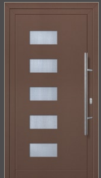
Modell Linnea Aluminium-Füllung, Marone CH 607 mit Isolier-Glas: außen Float klar innen Mastercarré Edelstahlgriff 214