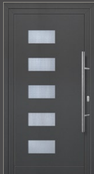
Modell Linnea Aluminium-Füllung Anthrazit CH 703 mit Isolier-Glas: außen Float klar innen Mastercarré Edelstahlgriff 214