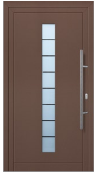
Modell Julissa Aluminium-Füllung Marone CH 607 mit Isolier-Glas: außen Float klar innen Float sandgestrahlt mit klaren Streifen Edelstahlgriff 214