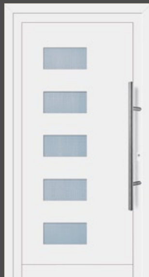
Modell Linnea Aluminium-Füllung Weiß RAL 9016 mit Isolier-Glas: außen Float klar innen Mastercarré Edelstahlgriff 214