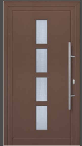
Modell Malena Aluminium-Füllung Marone CH 607 mit Isolier-Glas: außen Float klar innen Mastercarré Edelstahlgriff 214