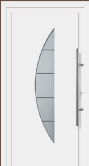
Modell Tiara Aluminium-Füllung Weiß RAL 9016 mit Isolier-Glas: außen Float klar innen Parsol grau sandgestrahlt mit klaren Streifen Edelstahlgriff 214

Die 1-flügeligen Türen erhalten Sie bis max. 1150 x 2250 mm. Auf Wunsch fertigen wir auch Anlagen für Sie mit Seitenteil, Oberlicht, Briefkasten und individueller Gestaltung. Die Lieferzeit beträgt ca. 24 Werktage.